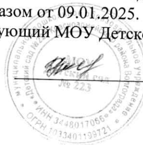
ГРАФИК РЕЖИМА ПРИЕМА ПИЩИ В ГРУППАХ